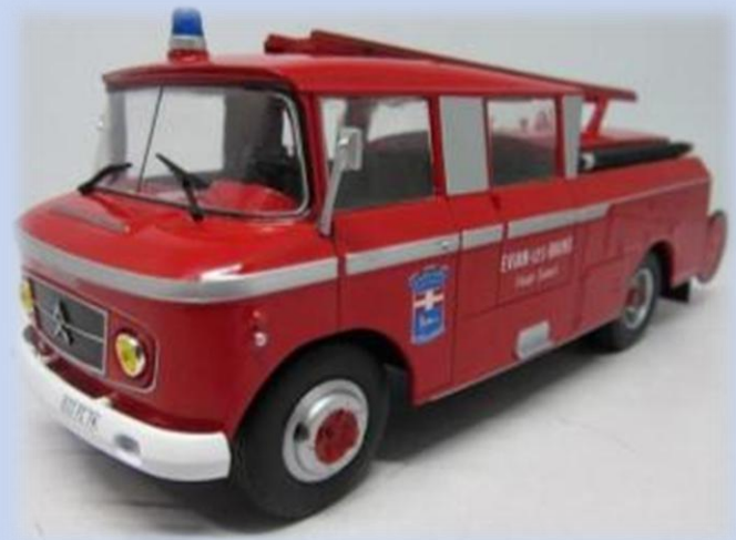
65 - FTP Guinard Citroen 46 CD Cabine Double Heuliez