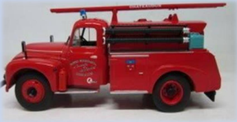
67 - CCI Drouville Citroen 46 CD

collection « Camions et Véhicules des Sapeurs Pompiers » (Hachette)