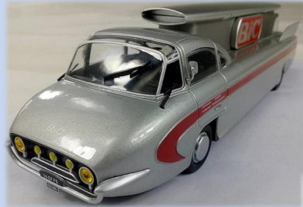
n°3 : Citroën Bic

collection « Auto Vintage - 1/24 » (Hachette) 13 - CITROËN Type H (1958)