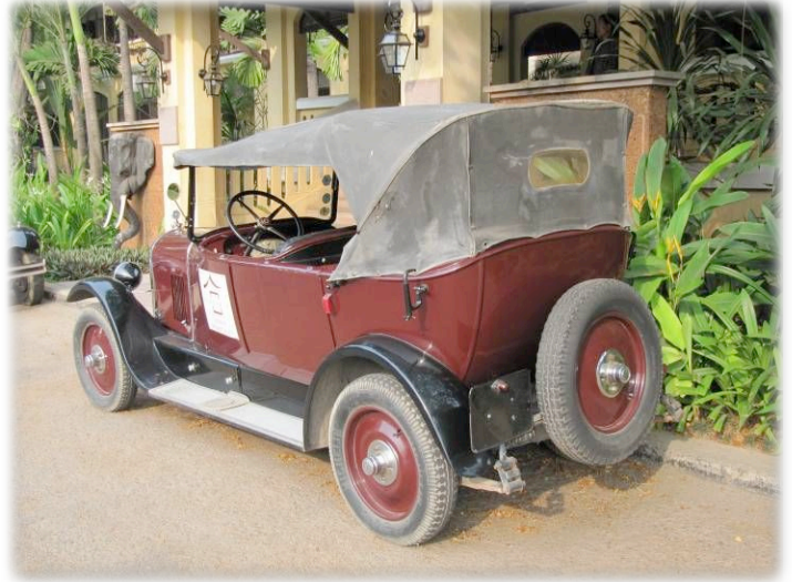
Torpédo B14 de 1928