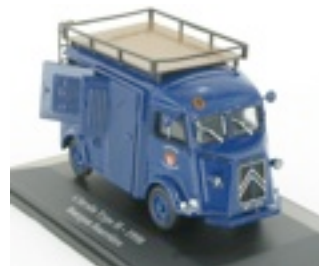
N°51 Type H fourgon fourrière de 1950