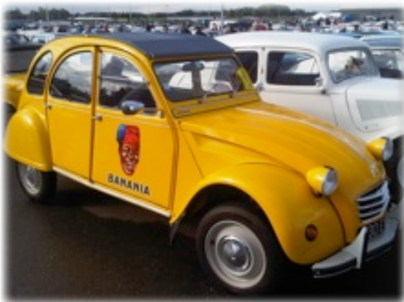
une voyante 2CV Banania

Ainsi on a pu admirer un superbe coupé DS Le Paris, deux mignonnes 2CV dans des livrées très colorées (les peintures Ripolin et Banania). Mais également une belle série de DS, toutes plus ou moins accessorisées, des SM, une frêle GSA Club ou encore une rare BX 4 TC. Un U23 dans son jus et une fière C4 dépanneuse avait fait le déplacement pour rappeler à tous les visiteurs que Citroën est également un fabricant de véhicules utilitaires.