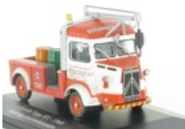
N°47 Type H pick-up, 1960