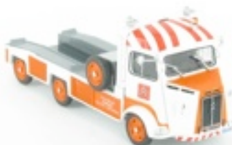
N°50 Type HZ IN plateau à six roues, 1964