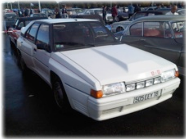
Le monstre : la BX 4TC

Organisée dans une période plutôt calme de l'année, je ne saurais que trop vous conseiller que de découvrir ou redécouvrir cette sympathique manifestation automnale dès l'année prochaine.