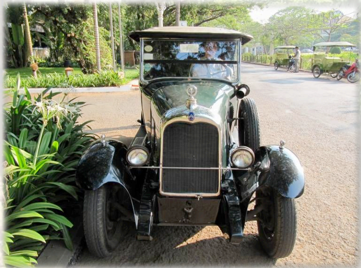
Torpedo B14 1927