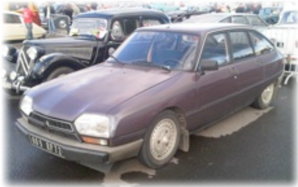
la GSA Club