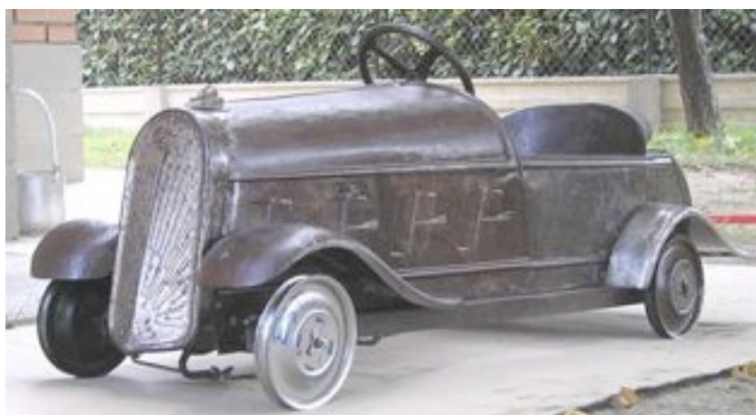
En cours de restauration