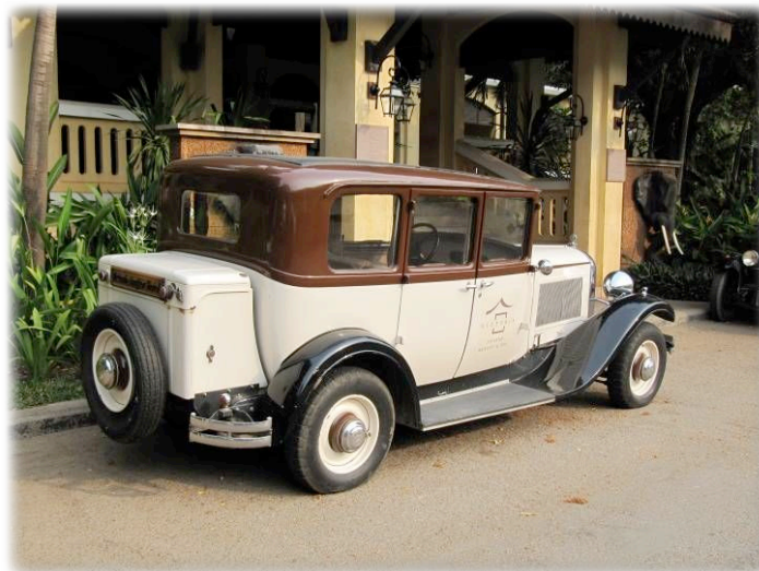
C6 de 1931 Remarquez l'immatriculation française !!!