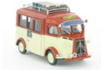
N°46 Type H autocar, 1952