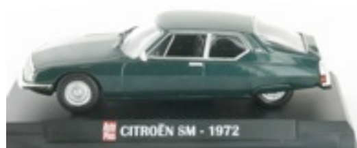
N°12 Citroën SM 1972