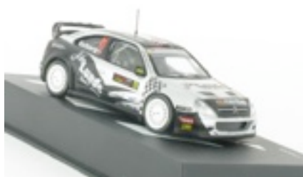
N°10 Citroën Xsara WRC Peter Solberg - Phil Mills Cyprus Rally 2009