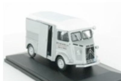
N°48 Type H épicerie ambulante, 1949