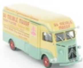
N°49 Type H chassis long pour les fabricants de meuble, 1956