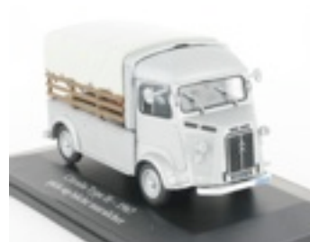
N°53 Type H pick-up bâché maraîcher de 1967

Merci à kiosque.doc pour toutes ces informations.