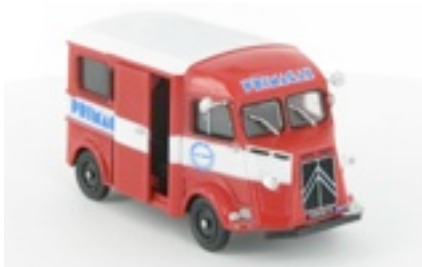
N°45 Type H fourgon vitré Primagaz de 1951