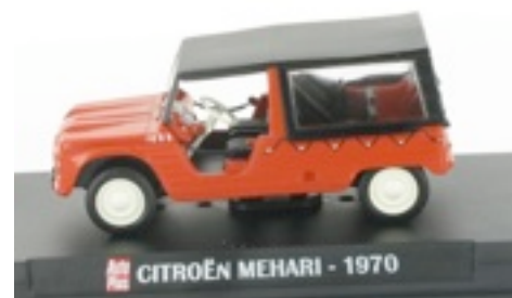
N°14 Citroën Méhari 1970