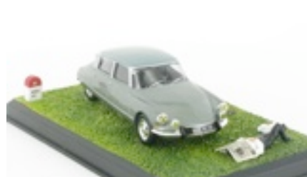
N° 53 Citroën DS19 Pallas