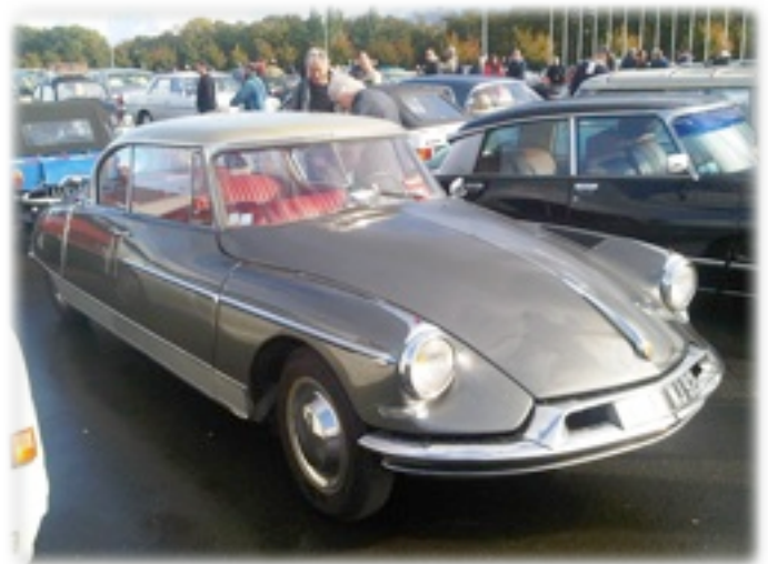
DS coupé LeParis