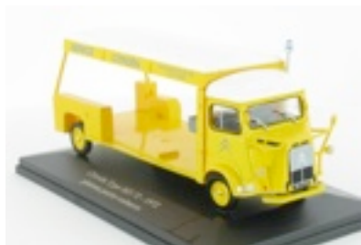
N°52 Type HZ-72 plateau porte- voitures un écrin hollandais