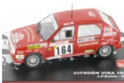
N°105 Citroën Visa mille Pistes