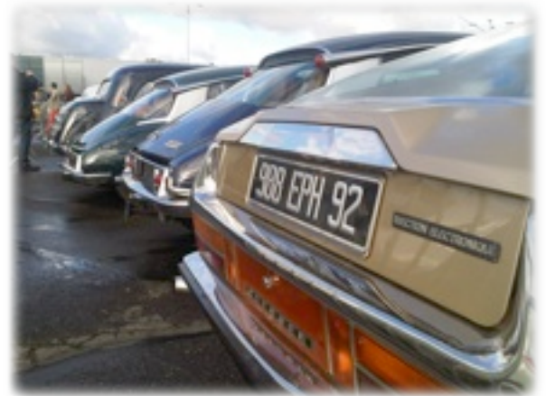
une jolie SM