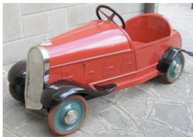
Restauration finie, du beau travail