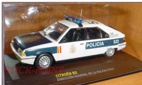
CITROËN BX POLICE 1992