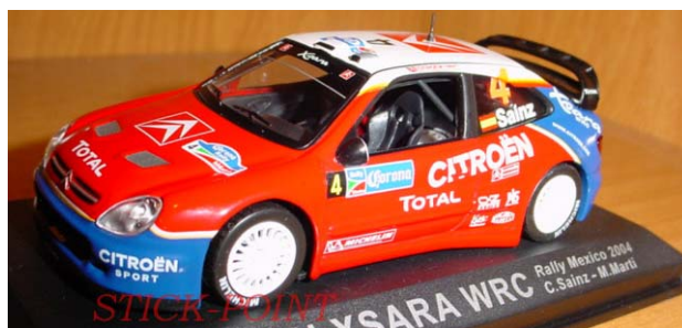
CITROËN Xsara WRC Carlos SAINZ-MARTI – Rallye du Mexique 2004