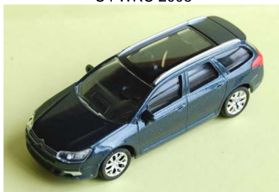
C5 2008 tourer