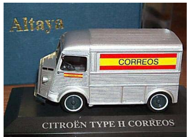
CITROEN Type H Correos