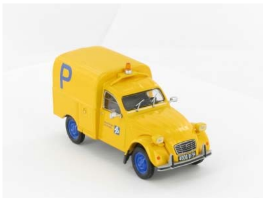
N° 154 La 2CV AKS 400 aéroports d'Île-de-France