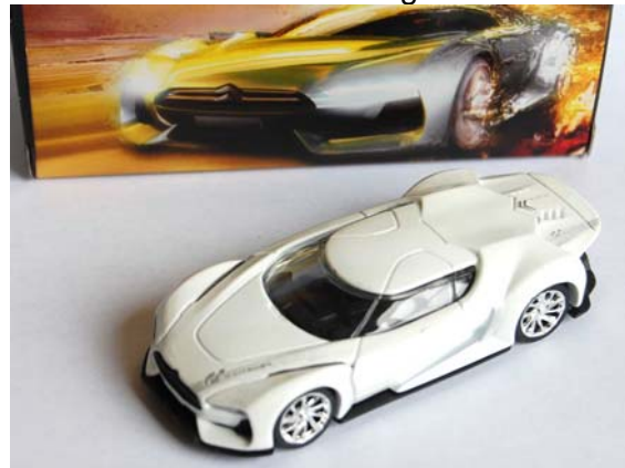
GT by Citroën →