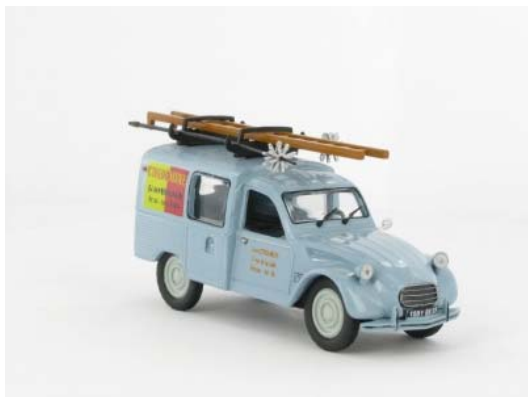
N° 146 La 2 CV AK 350