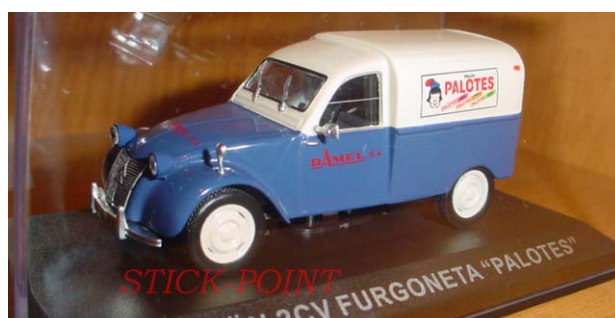
CITROËN 2CV FURGONETA AZU PALOTES