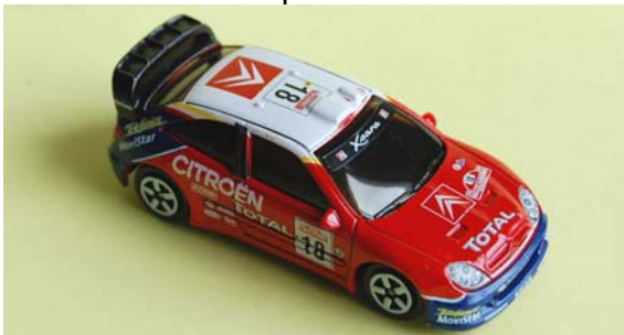
Xsara XRC San Remo