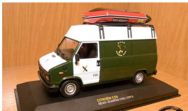
CITROËN C 25 GEAS GUARDIA CIVIL 1991