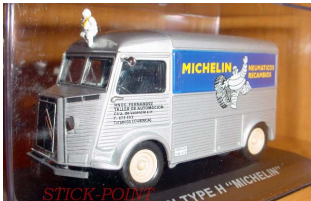
CITROEN Type H Michelin