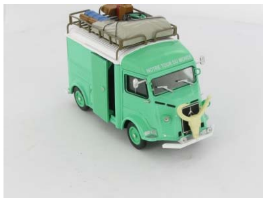
N° 26 Type HY-DI Perkins Aventuriers 1964