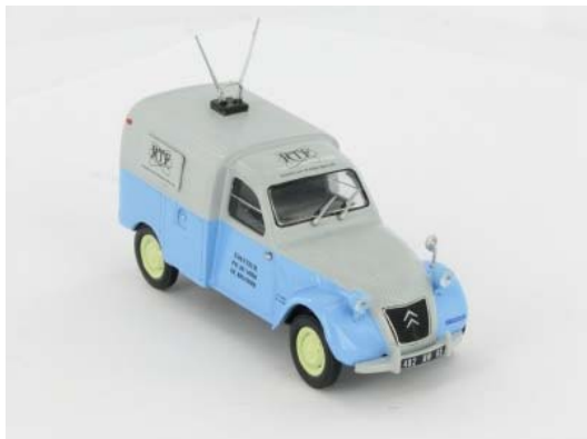
N° 147 La 2CV ORTF