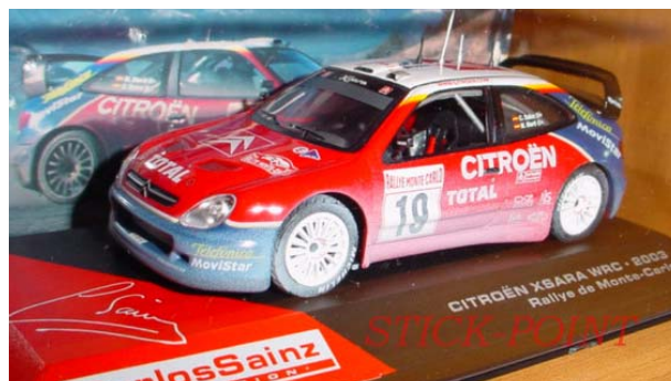
CITROËN Xsara WRC Carlos SAINZ – Monte Carlo 2003