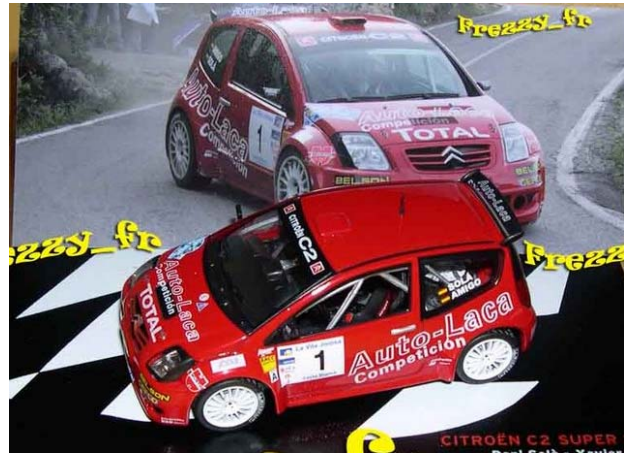
CITROËN C2 S1600 Dani SOLA - Rallye La Vila Jolosa 2006