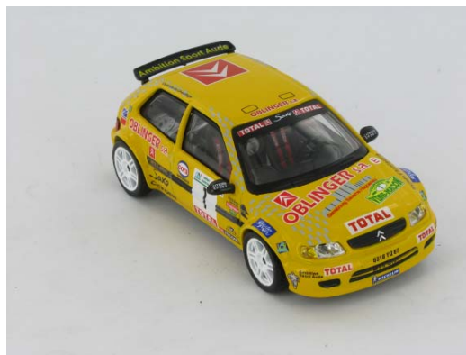
N° 25 Citroën Saxo Kit Car Rallye des Vins Mâcon 1999

Merci à kiosque.doc pour toutes ces informations.