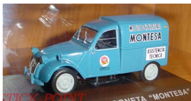
CITROËN 2CV Fourgonnette Montesa