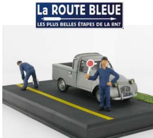
N° 34 La Citroën 2CV pick-up