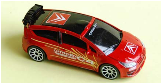
C4 WRC Concept Car NEW RAY