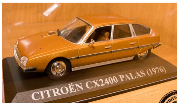
CITROEN CX2400 PALAS 1976

Identique à celle de la collection française mais avec un seul « L » à PALAS