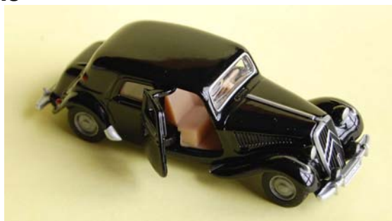
Traction 15/6 - avec portes ouvrantes