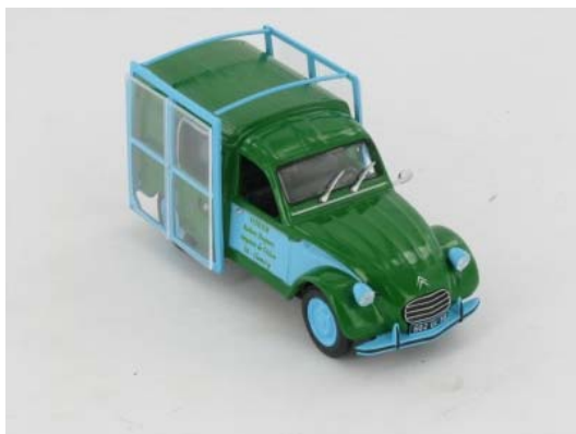
N° 153 La 2CV AK 350