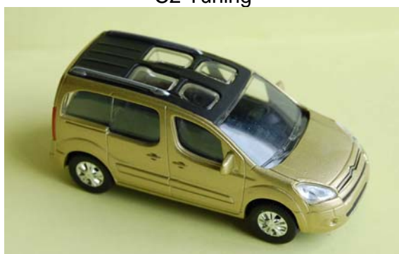
Berlingo 2008 XTR