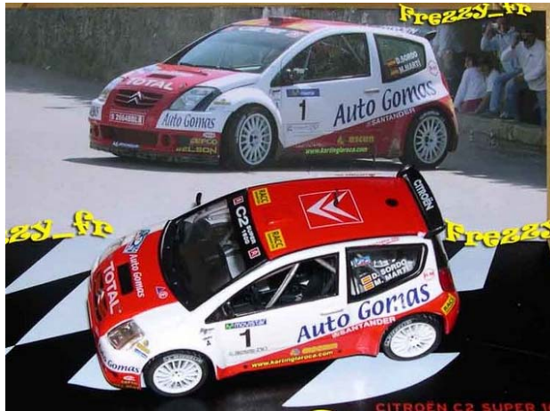
CITROËN C2 S1600 Dani SORDO – Rallye Cantabria 2005