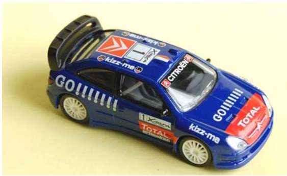
Xsara WRC 2006 Kronos Loeb