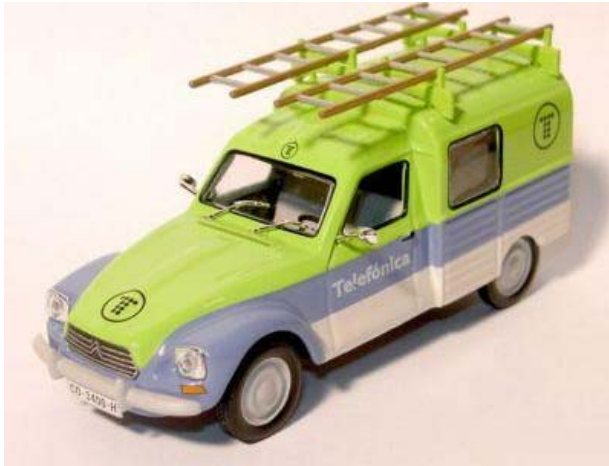
CITROEN Dyane 6 Telefonica