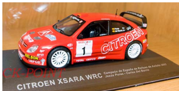
CITROËN Xsara Jesús PURAS – Champion d'Espagne Asphalte 2002