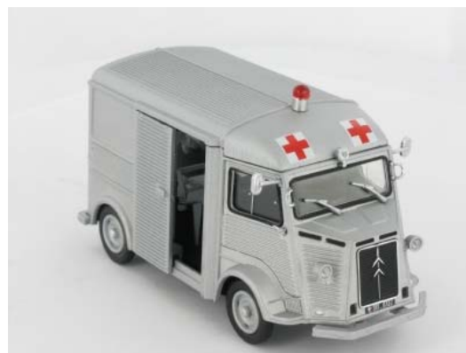
N° 20 Type HE-IN Ambulance Militaire -1968- Pour les "aviateurs"