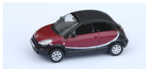
C3 Pluriel Charleston (au 1/87 ème )

Avant la fin de l'année on attend au 187 ème en NOREV une DS 23 et une C6 en BREKINA une DS Break, et en WELLY une DS 19 cabriolet