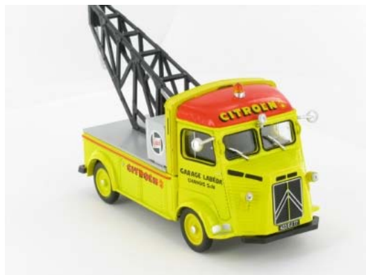
N° 27 Type H plateau-cabine de garagiste de 1956