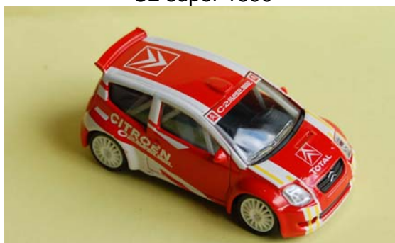
C2 super 1600