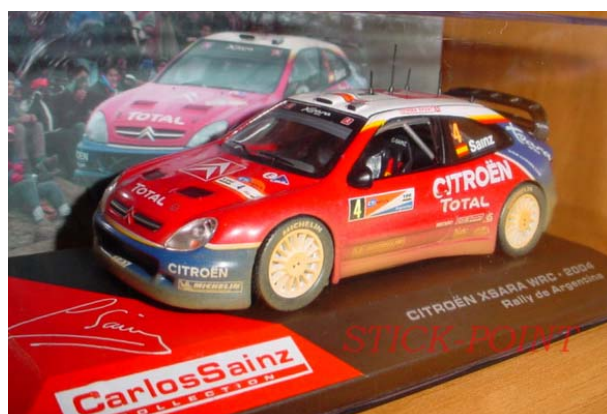
CITROËN Xsara WRC Carlos SAINZ – Rallye d'Argentine 2004