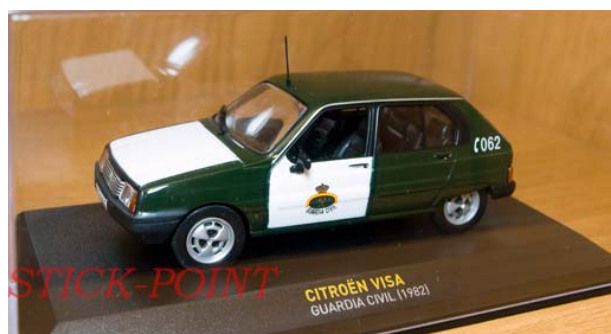
CITROËN VISA GUARDIA CIVIL 1982