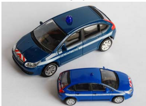
C4 berline Gendarmerie (3 inches et 1/87 ème )