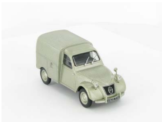
N° 148 La 2CV AU