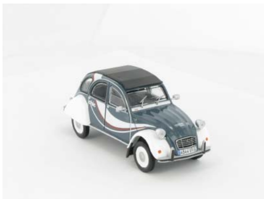
N° 152 La 2CV Chic