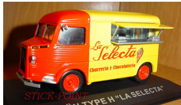
CITROEN Type H La Selecta