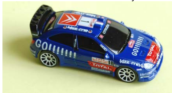
Xsara XRC Kronos 2006