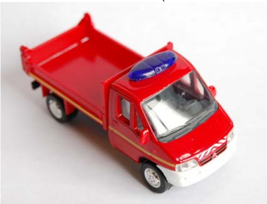
← Jumper Pompiers