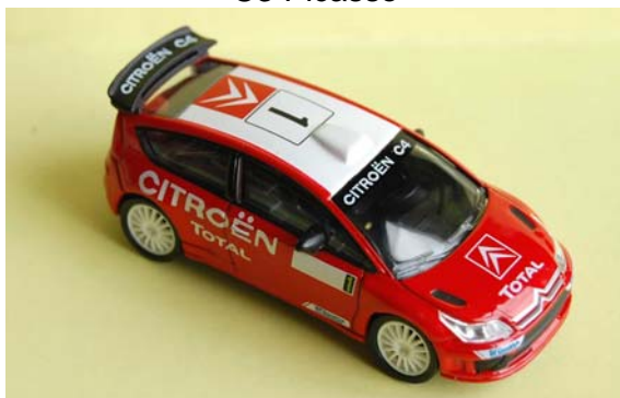
C4 WRC 2007