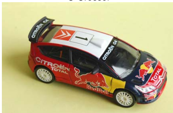
C4 WRC 2008