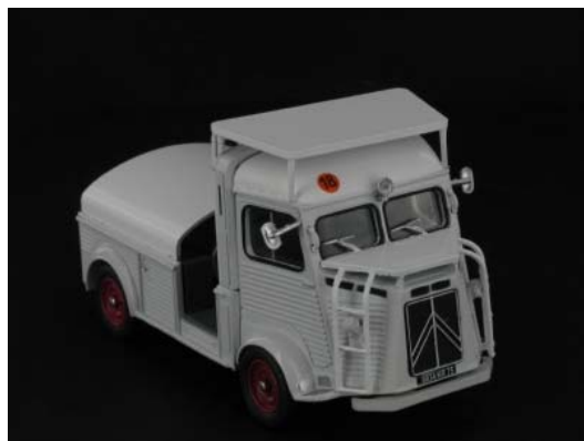
N° 25 Type HY plateau-cabine aéroport, 1960 Pour une fois sur les pistes