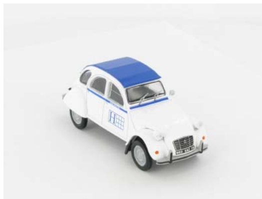
N° 149 La 2CV Spécial E de 1981