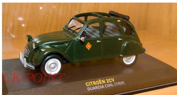
CITROEN 2CV GUARDIA CIVIL 1969