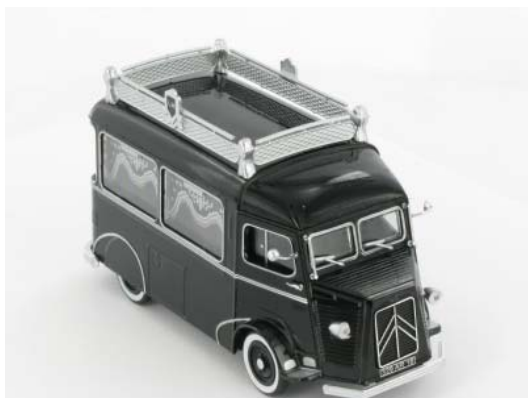
N° 22 Type H fourgon mortuaire, Pour un dernier voyage, 1953