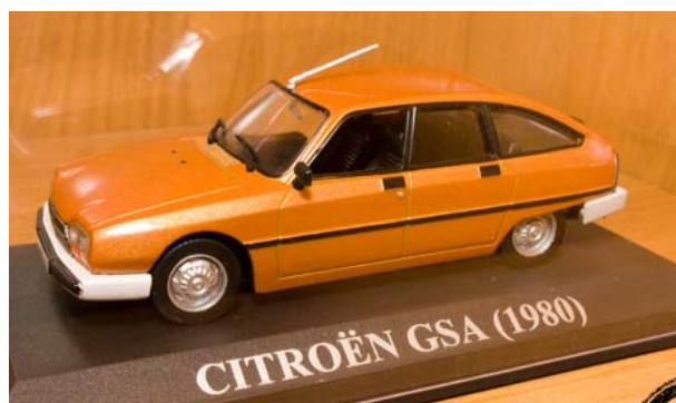
CITROEN GSA 1980