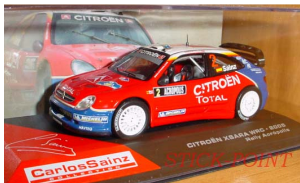
CITROËN Xsara WRC Carlos SAINZ – Rallye de l'Acropole 2005