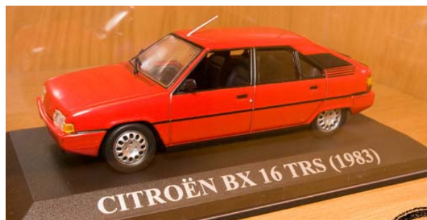
CITROEN BX 16 TRS 1983

Identique à celle de la collection française mais avec un seul « L » à PALAS