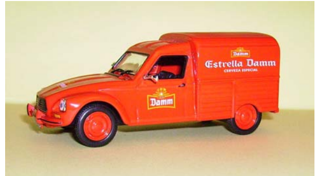
CITROEN Acadiane DAMM

Particularité : elle n'a pas de vitre latérale, c'est ce modèle qui a servi de base à l'Acadiane de la collection test Michelin en France