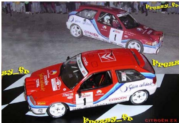
CITROËN ZX 16V CLIMENT-MUÑOZ – Rallye San Froilan 1996