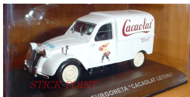
CITROËN 2CV FURGONETA AZU CACAOLAT-LETONA