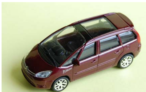
C4 Picasso toit vitré