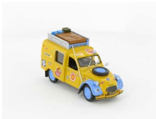
N° 150 La 2CV AK 350