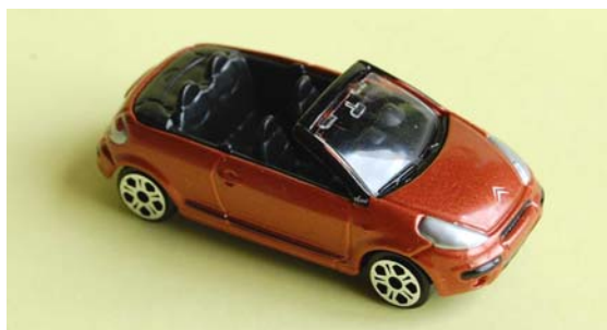
C3 Pluriel WELLY