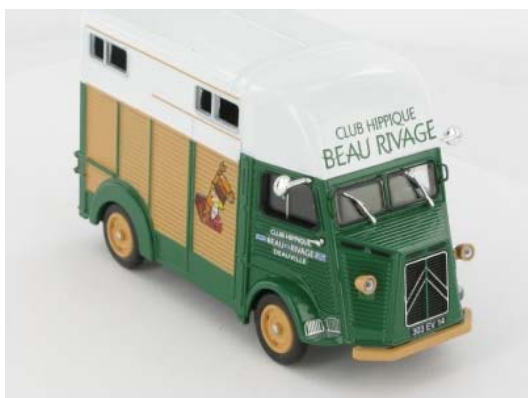
N° 24 Type H club hippique, Pour nos amis les chevaux, 1958