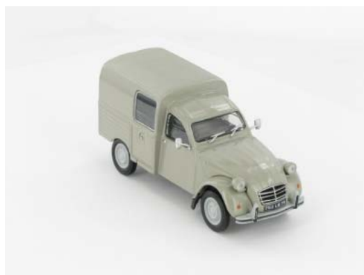
N° 151 La 2CV AKS 400