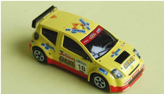
C2 Trophé Andros