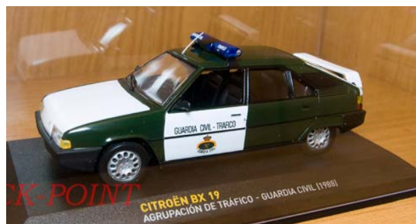
CITROEN BX 19 GUARDIA CIVIL 1988