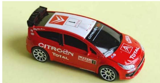
C4 WRC 2007 MAISTO