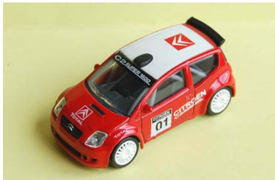
C2 super 1600