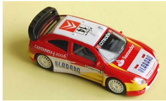
Xsara WRC 2006 Kronos Sordo