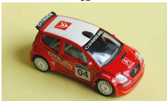
C2 super 1600