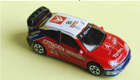
Xsara XRC Wales Rally