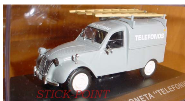
CITROËN 2CV Fourgonnette Telefonica