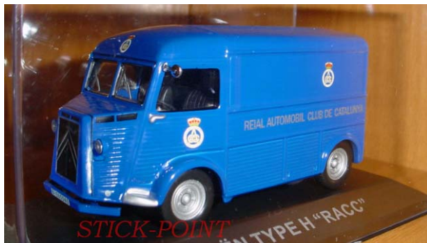
CITROEN Type H 1:43 RACC

Particularité : elle n'a pas de vitre latérale, c'est ce modèle qui a servi de base à l'Acadiane de la collection test Michelin en France