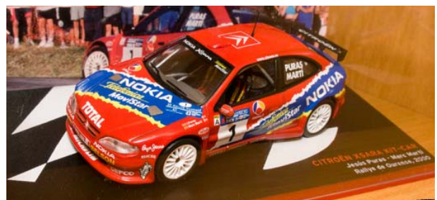
CITROËN Xsara KIT-CAR PURAS-MARTI – Rallye de Ourense 2000