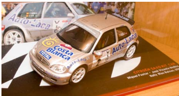
CITROËN Saxo KIT CAR Miguel FUSTER – Rallye Rias Baixas 2003