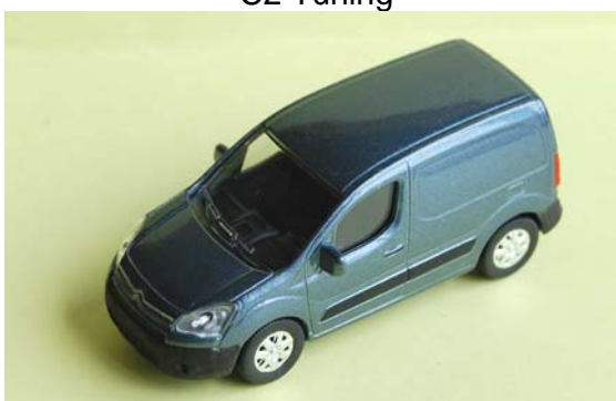
Berlingo 2008 tolé