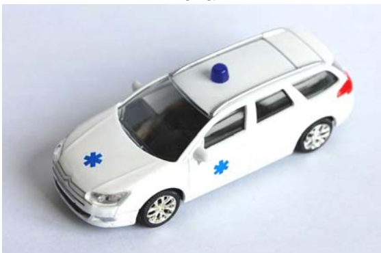
C5 tourer ambulance