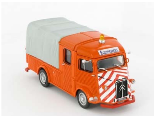
N° 23 Type HY plateau double cabine, Au service des voies royales, 1968