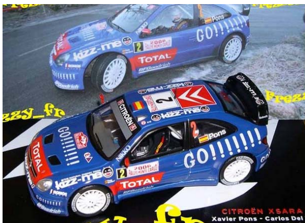
Citroën Xsara WRC Xavier PONS – Monte Carlo 2006