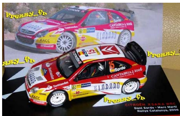
Citroën Xsara WRC SORDO-MARTI – Rallye Catalunya 2006