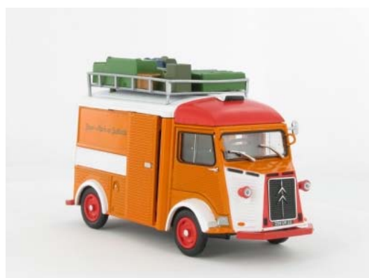
N° 19 Type HY 78 camping-car, 1960