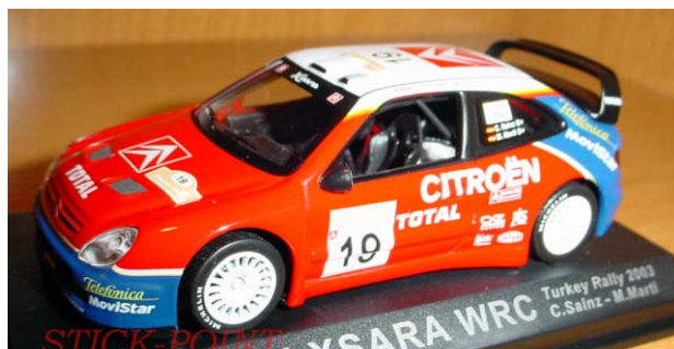
CITROËN Xsara WRC Carlos SAINZ – Rallye de Turquie 2003