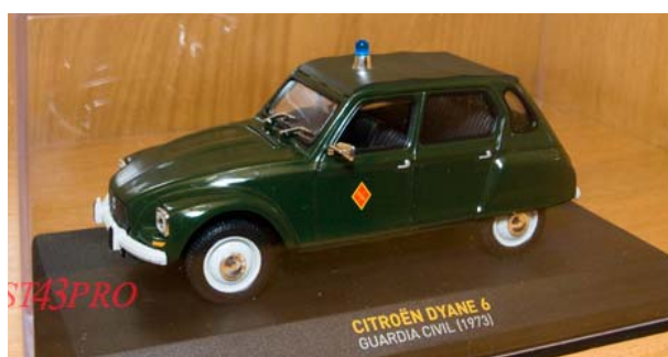
CITROËN DYANE 6 GUARDIA CIVIL 1973